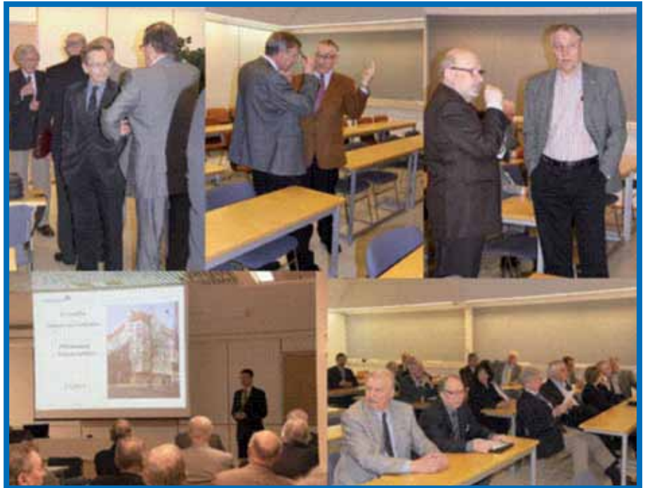
Illan aiheet ja maailman tapahtumat puhuttivat yrityskummeja ja yrittäjiä kevään teemaillassa